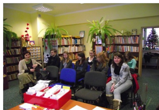
Uczestnicy projektu