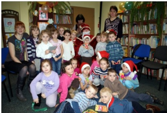
Przedkolaki na zajęciach w bibliotece