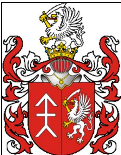
Chodkiewicz, polski herb szlachecki (Gryf z Mieczem), odmiana herbu Kościusza

W wyniku głosowania ustalono, że gimnazjum będzie nosiło imię Rodu Chodkiewiczów.