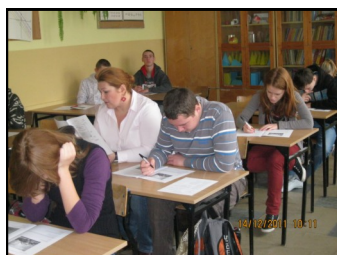
Próbny egzamin z mamą