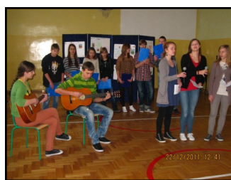
Kolędowania czas nastał