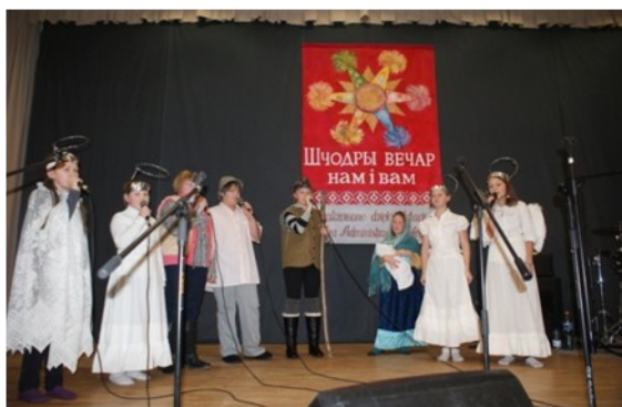
Biblioteczna grupa teatralna